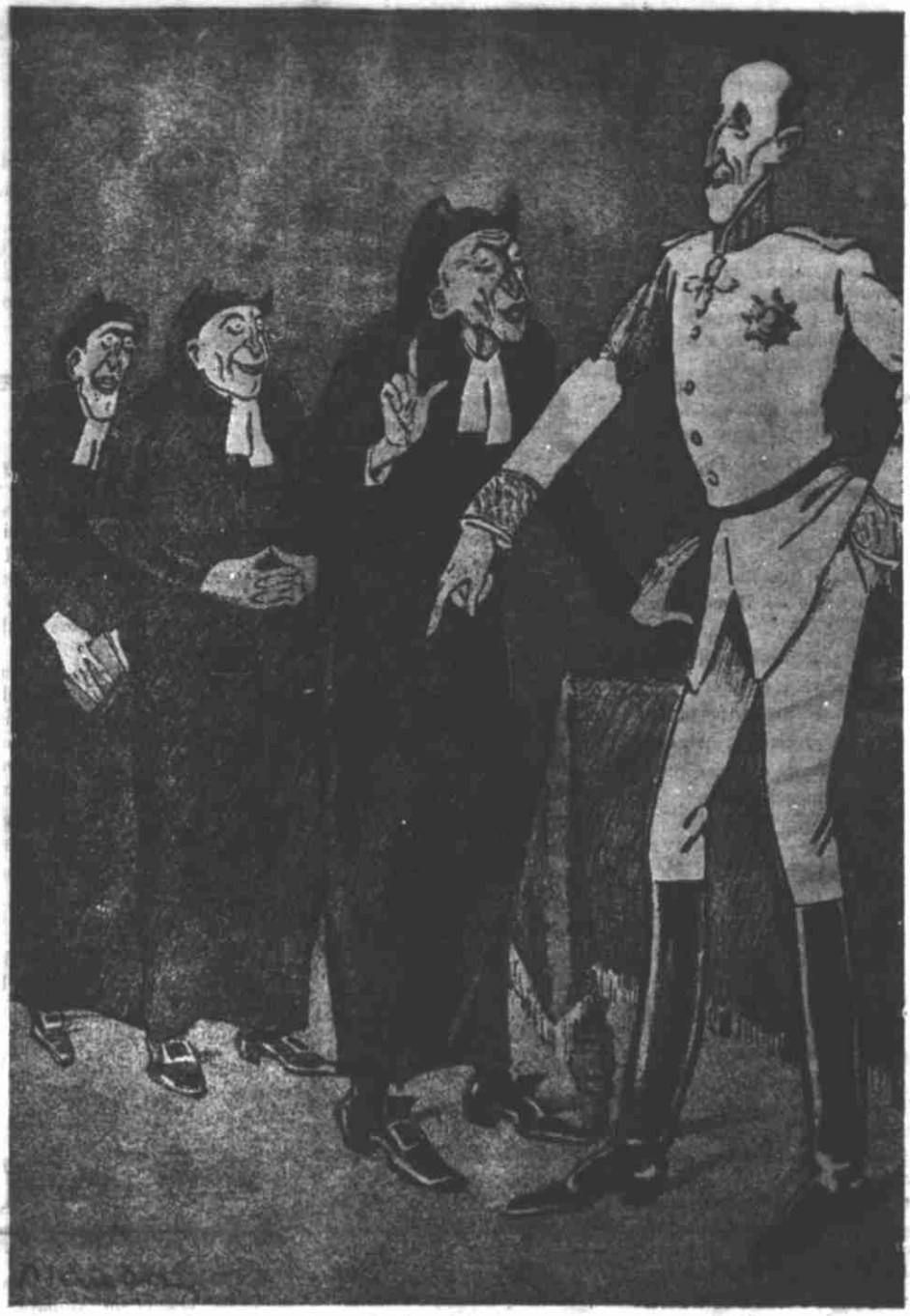
AFFONSO — Doravante cada um poderá pensar como entender... O JESUITA — Menos tu, pequerrucho...

Querem dominar ainda, querem ainda matar para maior gloria de Deus e de Santo Ignacio de